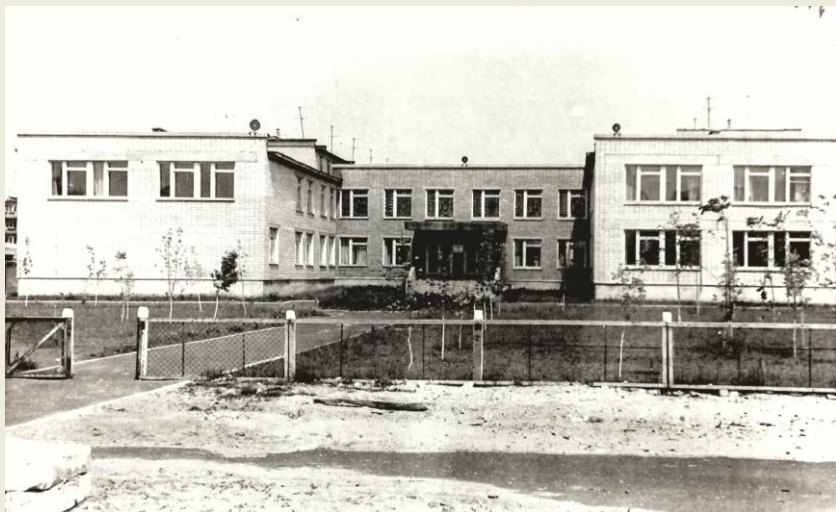
Музыкальная школа №2 г. Дзержинск, Нижегородская область, 1974 год.